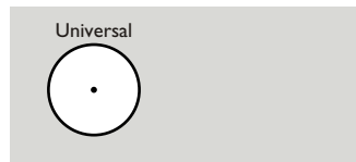
Posição de funcionamento